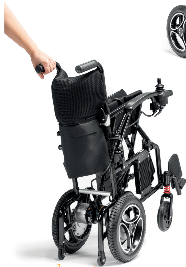
Petites roues arrière anti-bascule