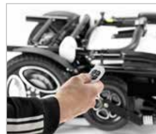
› Pliage électrique

Grâce à sa télécommande, il se plie et se déplie en 5 secondes.