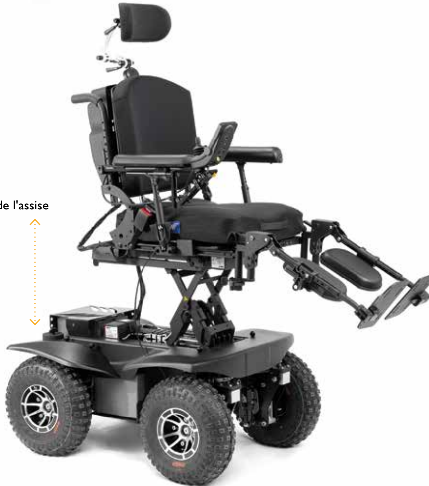
Élévation électrique de l'assise 28 cm (Option assise AMY)