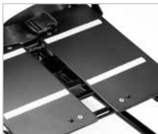
› 2 largeurs d'assise

Plaque d'assise réglable en 40 ou 45 cm de large.