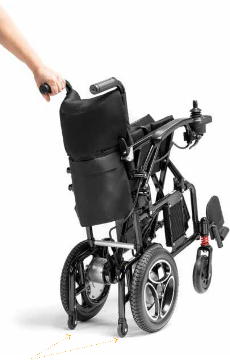
Petites roues arrière anti-bascule