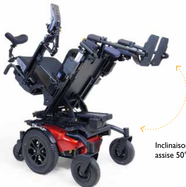
Inclinaison électrique assise 50°