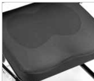
› Coussin confortable

Plaque d'assise réglable en 40 ou 45 cm de large.