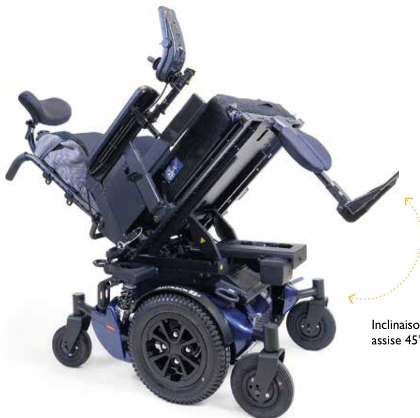
Inclinaison électrique assise 45°