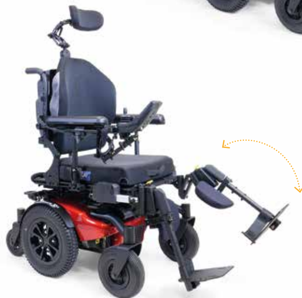
Repose-jambes individuels éleveurs et articulés. (disponibles en combinés ou indépendants)